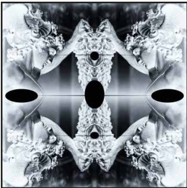
Rafał Boettner-Lubowski, Nieznany Rytuał -Transfiguracja, 2024