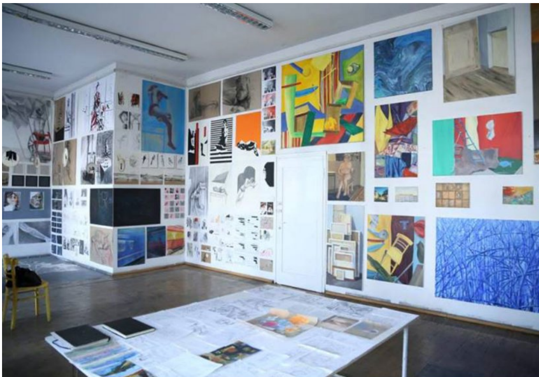
Ilustracja nr 6