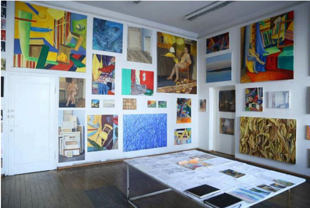
Ilustracja nr 3