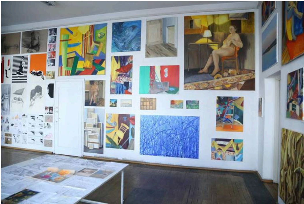
Ilustracja nr 5