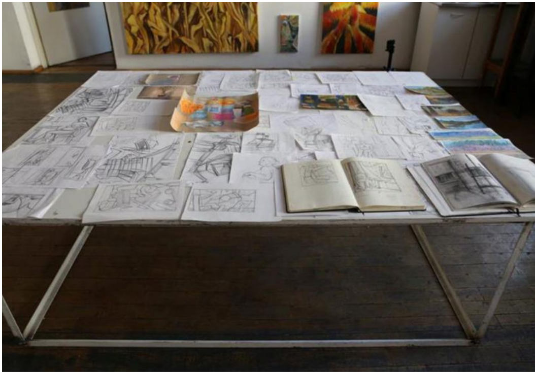
Ilustracja nr 1