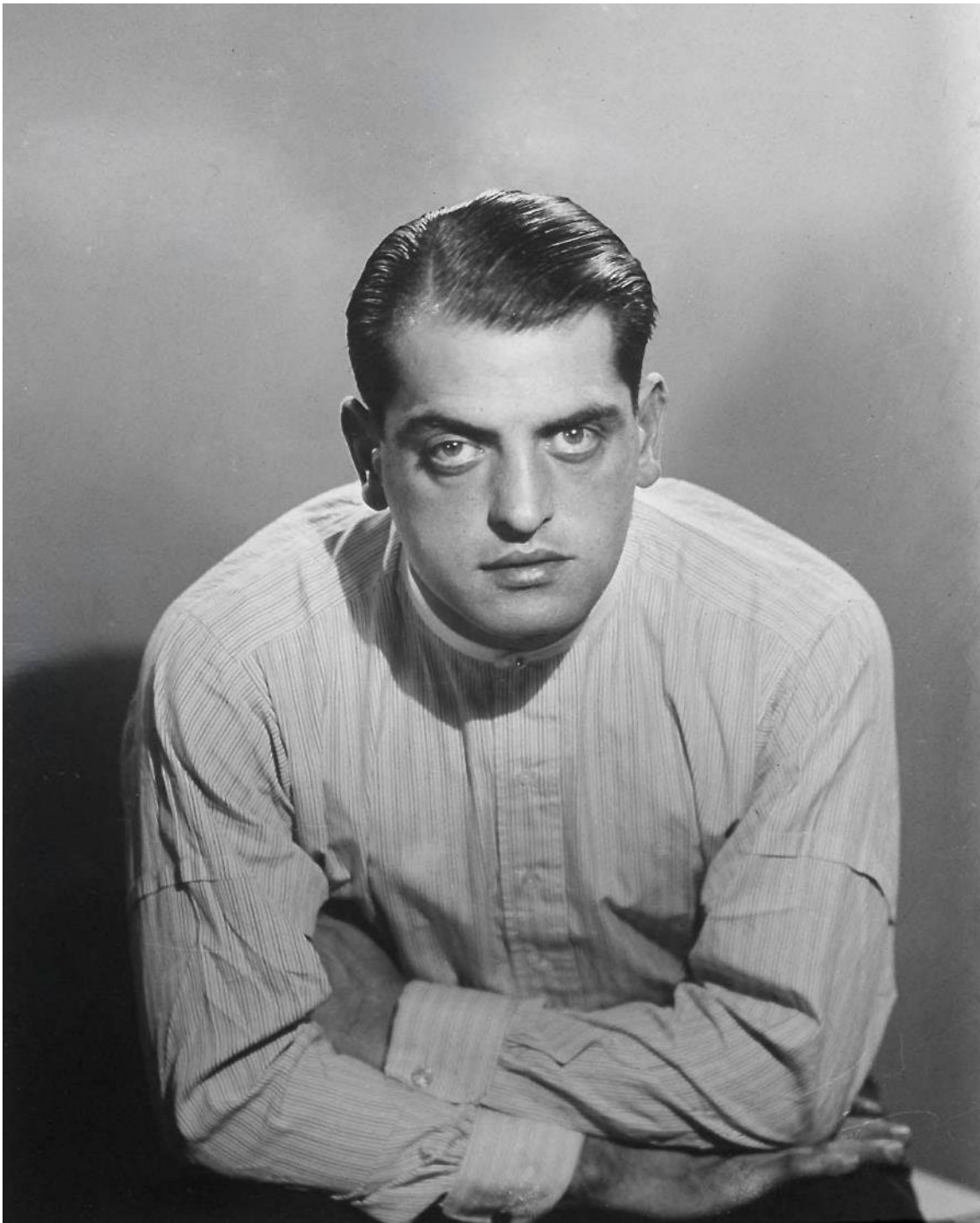
Ilustracja 2. Luis Buñuel

https://pl.wikipedia.org/wiki/Luis_Buñuel