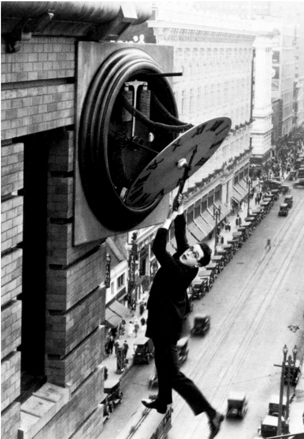
Ilustracja 4. Harold Lloyd

https://pl.wikipedia.org/wiki/Harold_Lloyd