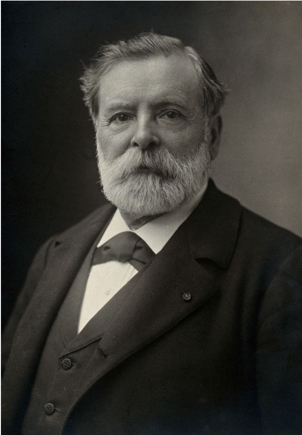
Ilustracja 6. Étienne-Jules Marey.

https://pl.wikipedia.org/wiki/Étienne-Jules_Marey