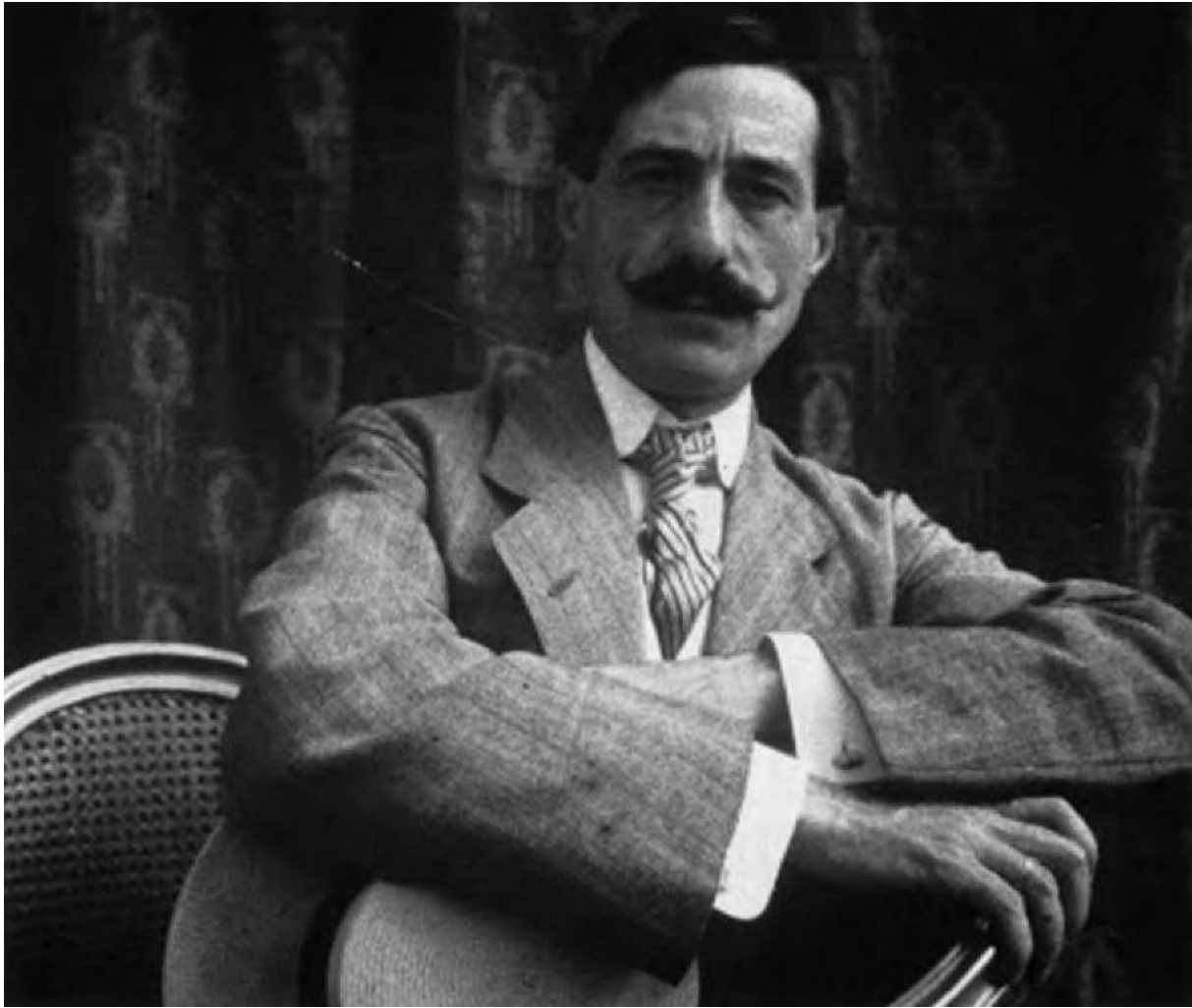
Ilustracja 1. Segundo de Chomón

https://pl.wikipedia.org/wiki/Segundo_de_Chomón