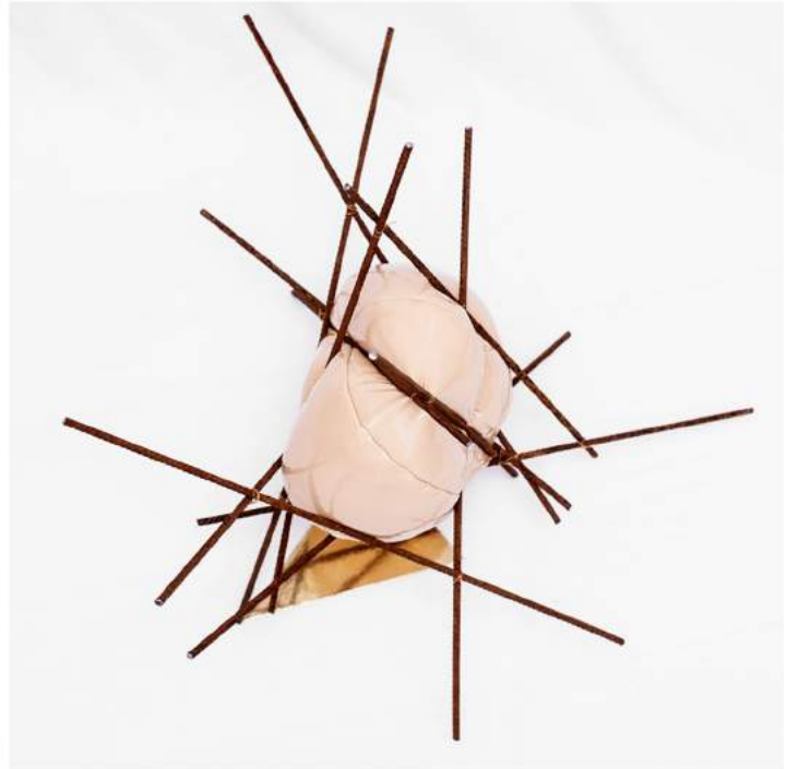
Patrycja Przedwojska Fotografia edytorska, III rok, I st. „Bez tytułu”